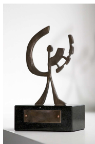
Hans Heinrich Stelljes Preis

Auch in diesem Jahr ruft sie wieder Personen aus Stadt und Landkreis auf, die sich in besonderer Weise in der Region Lüneburg engagiert haben. Dabei spielt es keine Rolle, ob die Bewerber beispielsweise aus den Bereichen Sport und Soziales, Kultur, Umwelt und Wissenschaft stammen. Ausgelobt werden in diesem Jahr drei Preise, die mit jeweils 1.000 Euro dotiert sind. Die Preise werden in den Kategorien Soziales, Kunst und Sport vergeben. Vorschläge können von allen in Stadt und Landkreis lebenden Personen eingereicht werden und sind formlos zu begründen. Sie müssen schriftlich bis zum 31. August bei der Hans Heinrich Stelljes Stiftung, An der Münze 4-6, 21335 Lüneburg vorliegen. Weitere Informationen gibt Nicole Bloch unter der Telefonnummer (04131) 288-636.